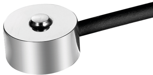
Miniatur-Druckkraftaufnehmer, Typ F1814