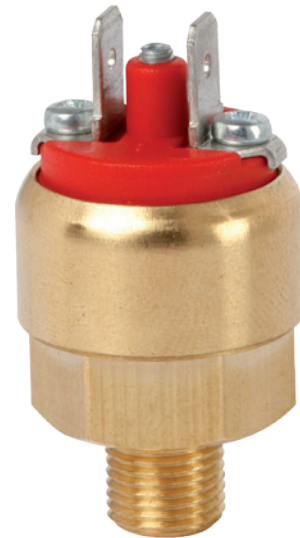
OEM-Kompaktdruckschalter, Miniaturbauweise, Messingausführung, Typ PSM05