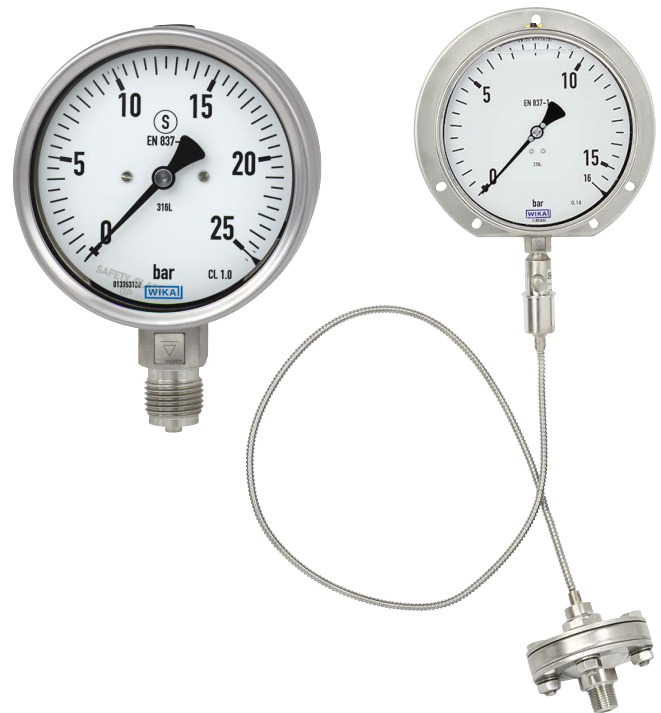
Fig. de gauche : intégré dans un manomètre