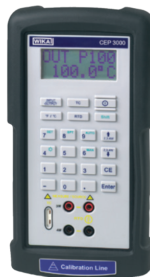
手持式温度校准仪, CEP3000型