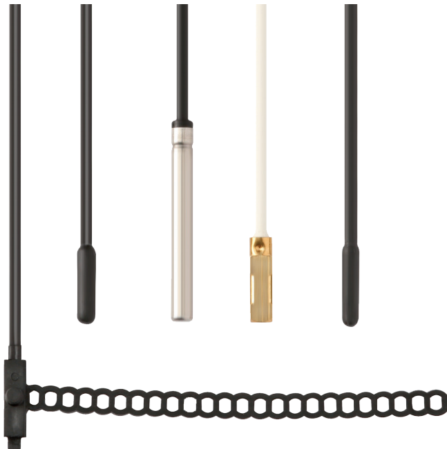
Погружной термометр, модель TF43